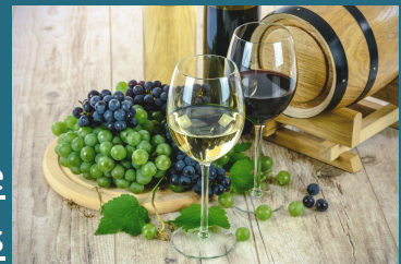
Cata de vinos