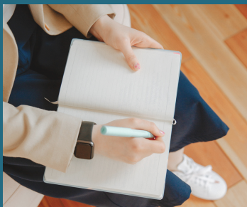
Sesión de Coaching