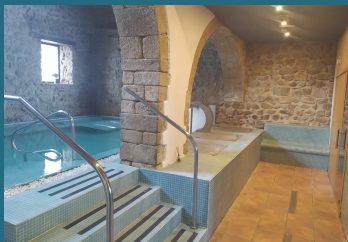
Circuito de aguas